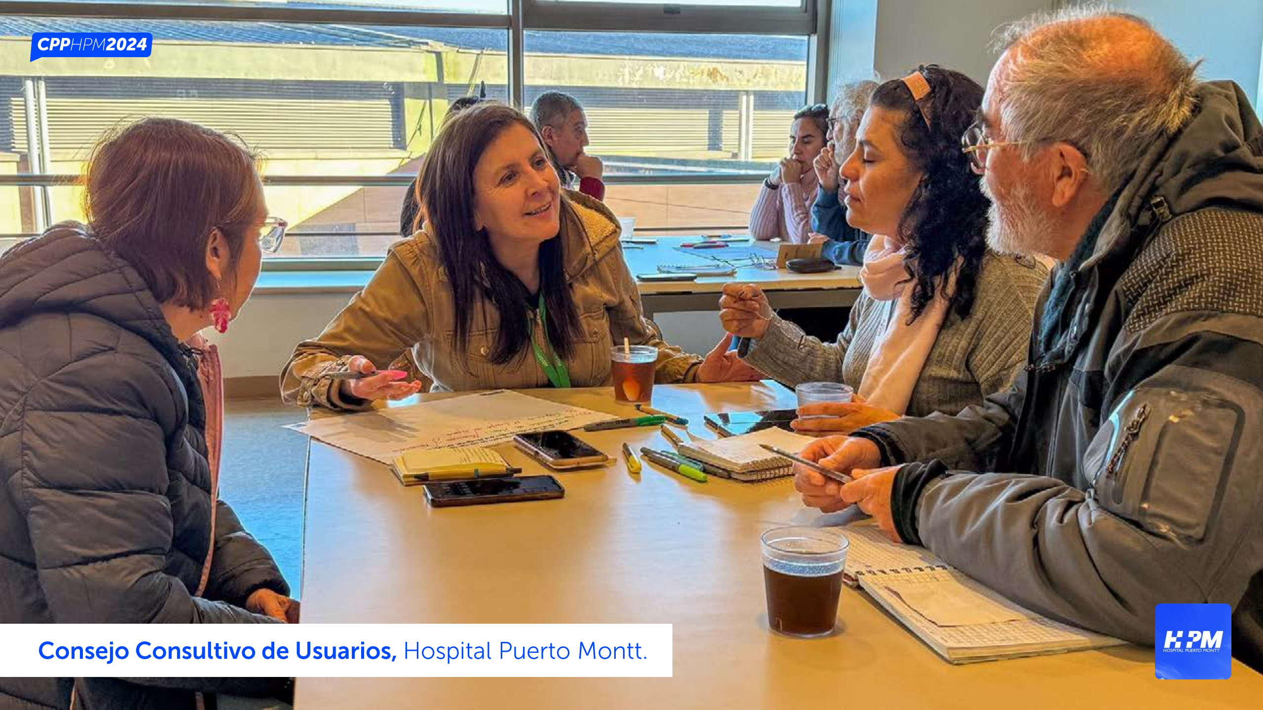
Consejo Consultivo de Usuarios, Hospital Puerto Montt.