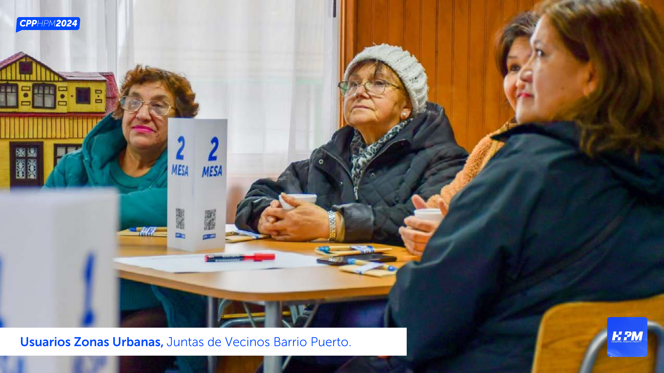
Usuarios Zonas Urbanas, Juntas de Vecinos Barrio Puerto.